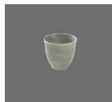
Bowl rund Struktur 10cm/0.34l Bowl round structure Bol rond structurée Tazón redondo estructura