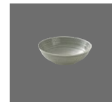
Schüssel rund Struktur 20cm/1.00l Dish round structure Saladier rond structuré Bol redondo estructura