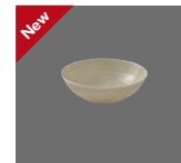
Schüssel rund Struktur 20cm/1.00l Dish round structure Saladier rond structuré Bol redondo estructura