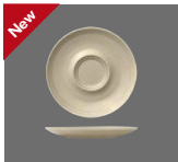
Untertasse rund mit Doppelspiegel Struktur 16cm Saucer round with double well structure Soucoupe ronde avec 2 tailles structurée Platillo redon. con espejo doble estructura