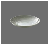
Teller tief rund coup Struktur Plate deep round coupe structure Assiette creuse ronde coup structurée Plato hondo redondo coupe estructura