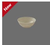
Schüssel rund Struktur 16cm/1.00l Dish round structure Saladier rond structuré Bol redondo estructura