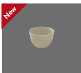
Bowl rund Struktur 10cm/0.28l Bowl round structure Bol rond structurée Tazón redondo estructura