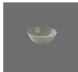
Schüssel rund Struktur 16cm/0.60l Dish round structure Saladier rond structuré Bol redondo estructura