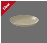
Teller tief rund coup Struktur Plate deep round coupe structure Assiette creuse ronde coup structurée Plato hondo redondo coupe estructura