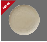
Teller flach rund coup Struktur Plate flat round coupe structure Assiette plate ronde coup structurée Plato plano redondo coupe estructura