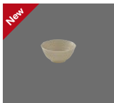
Schale rund Struktur 13cm/0.39l Bowl round structure Bol rond structuré Fuente redonda estructura