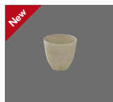
Bowl rund Struktur 10cm/0.34l Bowl round structure Bol rond structurée Tazón redondo estructura