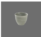
Bowl rund Struktur 10cm/0.28l Bowl round structure Bol rond structurée Tazón redondo estructura