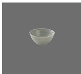
Schale rund Struktur 13cm/0.39l Bowl round structure Bol rond structuré Fuente redonda estructura