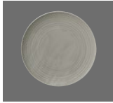
Teller flach rund coup Struktur Plate flat round coupe structure Assiette plate ronde coup structurée Plato plano redondo coupe estructura

Gewicht 1/Stck. Weight 1/pc. Poids 1/pièce Peso 1/pieza Gramm