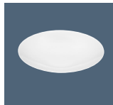
Plate deep round coupe Assiette creuse ronde coup Plato hondo redondo coupe